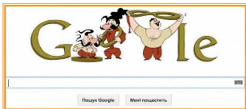
Нудл (заставка-логотип) пошуковика «Гугл» («Google»), присвячений ювілею мультфільма

Перший мультфільм циклу «Як козаки...» українські глядачі побачили в далекому 1967 р., останній вийшов у 1995 р. В одному з інтерв'ю Володимир Дахно згадував цікаві історії про створення фільмів: «Я не дуже довго мудрував з козаками. Взяв та й намалював трьох запорожців на кшталт трьох мушкетерів. Один вийшов кругленький і низенький, другий — худий і високий, третій — здоровий та рум'яний молодець. Потім мені казали, що я дуже точно передав в цих персонажах український характер».