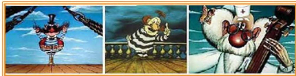
Фрагменти з мультфільму «Лікар Айболить»

Сім серій мультфільму про доброго д\ лікаря Айболита, який лікує звірів у себе вдома і рятує їх від страшного розбійника