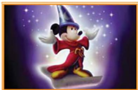
Фрагменти мультфільму «Фантазія» (1940 р. і 1999 р.)