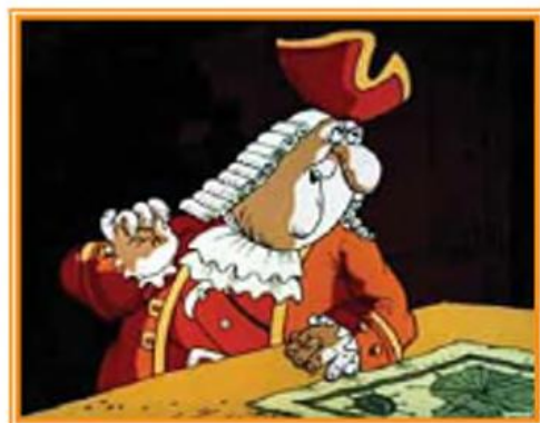
Герої мультфільму «Острів скарбів»