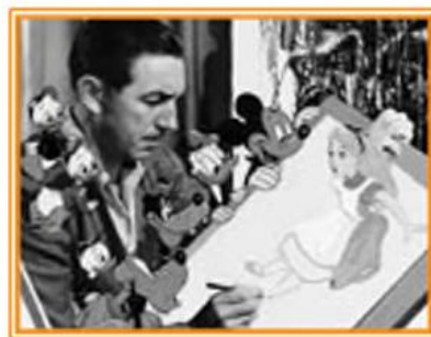
Волт Дісней зі своїми персонажами

Упродовж майже столітньої історії студія Дісней створила багато мультфільмів із чудовою музикою: «Білосніжка і Семеро гномів», «Піноккіо», «Попелюшка», «Спляча красуня» тощо.