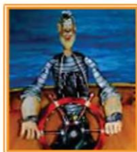
Герої мультфільму «Пригоди капітана Врунгеля»

Серед зразків української анімації для дітей надзвичайної популярності у 1970-1980-х рр. здобули багатосерійні фільми «Пригоди капітана Врунгеля» та «Лікар Айболить» режисера Давида Черкаського. Музику до цих мультиплікаційних історій написав Георгій Фіртіч.